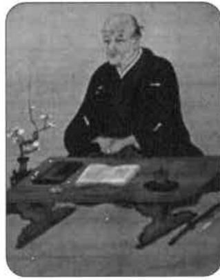
貝原益軒像