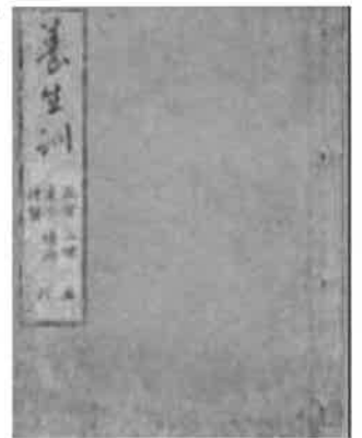
文化九年版養生訓の表紙（中村学園大学三成就教授所蔵）

友人たちと会食をするときは、おいしいものにむかうと、思わず食べ過ぎてしまう。飲食を満足するまで十分にとるのは不幸なものになる。「花は半開に見、酒は微酔にのむ」といわれるように実行するのがよい。興にのつて戒を忘れてはならない。自制なく欲のおもむくままにすると不幸になる。楽しみの絶頂は悲劇のもとになることが多い。