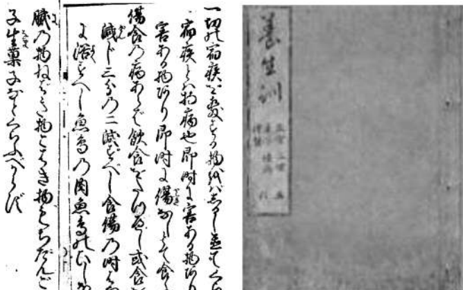
文化九年版養生訓の表紙 (中村学園大学三成就助教授所蔵)

食当りのときは絶食がよい。あるいは、食べる量を日頃の半分に減じ、または三分の二にまで減してもさしつかえない。食はずきのときは早く入浴するとよい。魚や鳥の肉、魚や鳥の干塩(干物)、生野菜、油っこいもの、ねばっこいもの、堅いもの、もちやだんご、そして菓子類などを食へてはいけない。