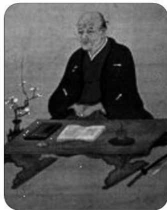
貝原益軒像 (貝原家ご所蔵)