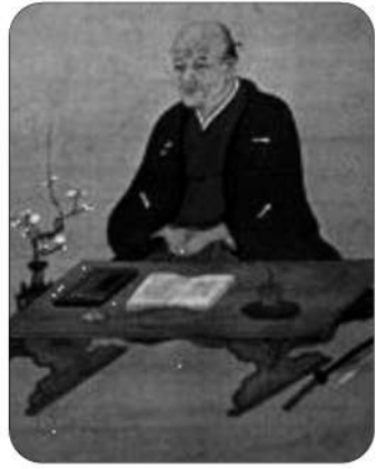
貝原益軒像 (貝原家ご所蔵)