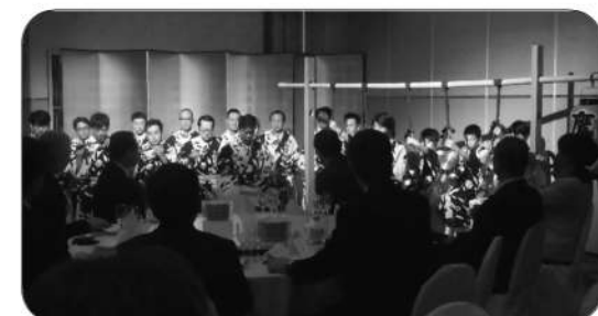
祇園囃子（鷹山保存会）

「自力でのみ食いきなくならたら「寿命」と考えよう・二〇二五年問題の処方箋」というテーマで講演をいただき、多数のご出席を得ました。 本年1月1日より、療養費の受療委任払い制度（窓口で自己負担分を支払う制度）が始まりました。保険での鍼灸治療が受けやすくなったこの機会に、是非とも鍼灸をお試しいただきますようお願い申し上げます。