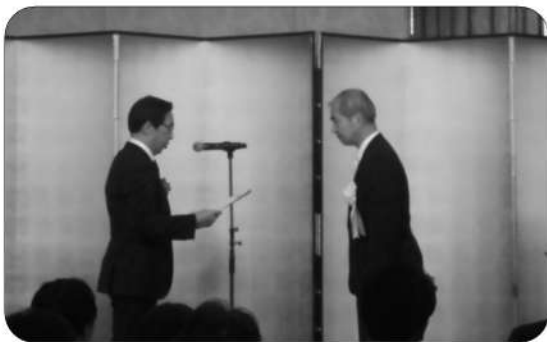
京都府理事表彰受賞（本会及び会員）

さて、鍼灸業界は「はり・きゅう」のなお一層の普及促進、昨今の地震や水害・豪雨・台風等の頻発する大規模災害に対する