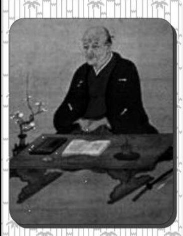
貝原益軒像

なお、長期的観察も不可欠で、専門医とのチームプレー、精神面での対応と技術および忍耐を要するといえます。 ●回答者：河内 明先生 元大阪医科大学附属病院麻酔科外来鍼灸部主任 鍼灸師 兵庫 明石市