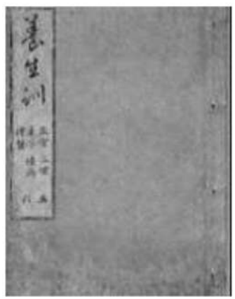
文化九年版養生訓の表紙 (中村学園大学三成助教授所蔵)

煮過してにえばなを失なへる物と、いまだ煮熱せざる物くらゐべからず。魚を煮るにに煮多ざるはあし。煮過してにえばなを失なへるは味なく、つかへやすし。よき程の節あり。魚を蒸たるは久しくむしても、にえばなを失なはず。魚をにるに水おおきは味なし。此事、李笠翁が閑情偶寄にいへり。